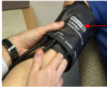
مشخصه اندازه (نوع) بازوبند

اگر از قبل هوایی درون بازوبند باشد، با باز کردن پیچ تنظیم هوای پمپ دستگاه، هوا را خالی کنید. لبه پایینی بازوبند باید ۳-۲ سانتیمتر بالاتر از نقطه ضریبان شریان بازویی (گودی یا چین آرنج) باشد. بازوبند را باید روی بازوی لخت فرد طوری بپیچید که فضای کافی برای این که بتوانید یک انگشت زیر بازوبند قرار دهید، داشته باشد.