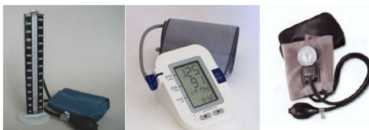
شکل ۲: انواع دستگاه های فشارسنج (عقربه ای، جیوه ای و دیجیتالی)

نشت کیسه هوا و لوله لاستیکی به علت ترک یا ساییده شدن لاستیک، سبب اندازه گیری نادرست فشارخون می شود. کیسه و دو لوله لاستیکی باید سالم و بدون نشت باشند. محل های وصل باید غیر قابل نفوذ باشند و براحتی از هم جدا شوند. مشکلات پیچ تنظیم هوا (دریچه کنترل) نیز یکی دیگر از عوامل ایجاد خطا در دستگاه فشارسنج است. دریچه های ناقص سبب نشتی هوا می شوند و کنترل تخلیه هوا و کم کردن فشار مشکل می شود. این مشکل می تواند باعث کم نشان دادن فشارخون سیستول و یا بیشتر نشان دادن فشارخون دیاستولی شود. نقص در دریچه کنترل براحتی با پاک کردن فیلتر یا تعویض دریچه کنترل برطرف می شود.